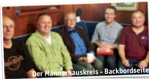
Der Männerhauskreis - Backbordseite