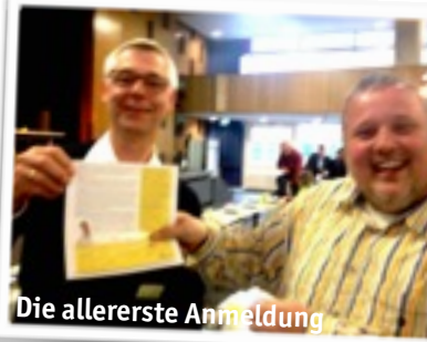
Die allererste Anmeldung