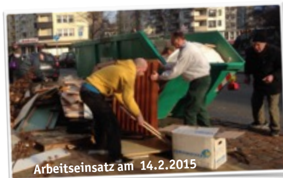
Arbeitseinsatz am 14.2.2015