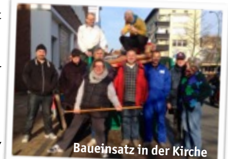
Baueinsatz in der Kirche

Es klingt erst einmal ein wenig verrückt, aber was wäre, wenn jemand uns als Gemeinde Wohnraum schenkt oder günstig überlässt? Dann könnten wir loslegen, wie im 2. Stock gemeinsam, Hand in Hand mit den Flüchtlingen. Und ganz nebenher entstehen gute Beziehungen. Mehr dazu auf der Bezirksversammlung.