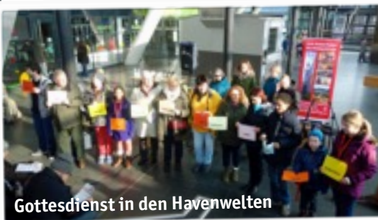
Gottesdienst in den Havenwelten

31.5. 11.30 Uhr OpenAir am Stadttheater (Theodor-Heuss-Platz)