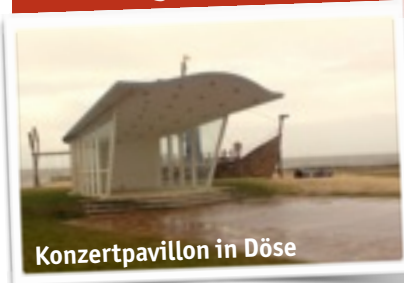
Konzertpavillon in Döse

Drei Gottesdienste draußen in 2 Monaten. Das ist neuer Rekord! Am 3.4. sind wir wieder an der Sportboot-schleuse und feiern Golgatha am Weserdeich.