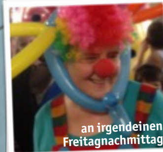
an irgendeinen Freitagnachmittag

Am 6.11. startet der Winterspielplatz 2015/2016 in diesem Jahr sogar mit Unterstützung des Stadtteilprogramms der Stadt Bremerhaven. Wieder wird eine Mannschaft gesucht, die Hüpfburg und Bastelecke betreut und wieder brauchen wir zusätzlich Leute, die mit den Eltern