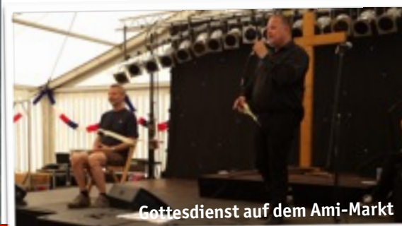
Gottesdienst auf dem Ami-Markt

1.11. 10.30 Uhr Gottesdienst & Kinderkirche