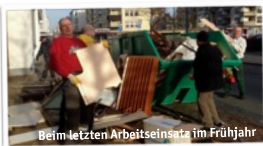
Beim letzten Arbeitseinsatz im Frühjahr

Zum ersten Mal tagte unser neuer Haus- und Bauausschuss am 21.7. Wichtigste Feststellung: Es gibt viel zu tun. Darum wurde der nächste Putz-Schraubtag gleich terminiert. Los geht es am 19.9. mit einem kleinen Frühstück. Wieder sind die Arbeiten so vielfältig, dass für jeden das Richtige dabei sein wird. Bitte seid darum wieder zahlreich dabei.