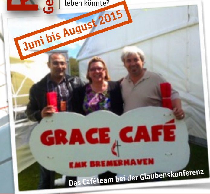
Das Cafeteam bei der Glaubenskonferenz