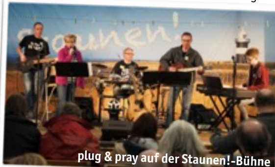
plug & pray auf der Staunen!-Bühne

Vielen Dank dafür, jetzt schon sind wir gespannt, wie es 2018 weitergeht.