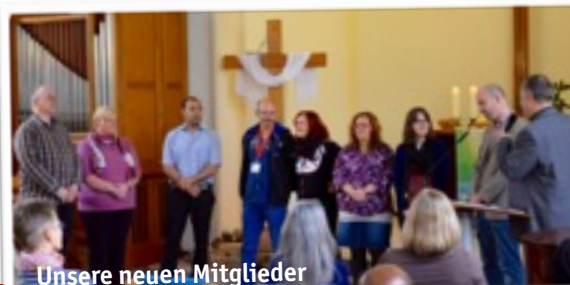
Unsere neuen Mitglieder

30.8. 10.30 Uhr Gottesdienst & Kinderkirche