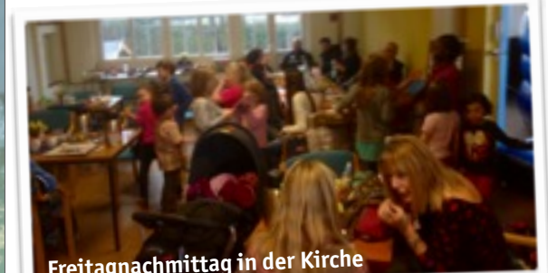
Freitagnachmittag in der Kirche

Gelebte Gastfreundschaft gehört zu den Grundwerten des christlichen Glaubens. Lasst uns darum fröhlich neu durchstarten.